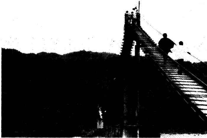
Le pont, unique voie d'accès au territoire des U'wa

"La décadence culturelle, la contamination toxique, l'invasion territoriale et la déforestation massive ont causé la ruine de dizaines de cultures indigènes et de millions d'hectares de forêt tropicale" , assurent-ils.