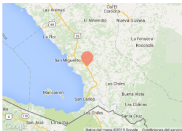
Ubicación de El Tule